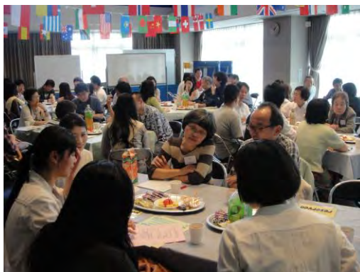
チュータープログラム説明・交流会