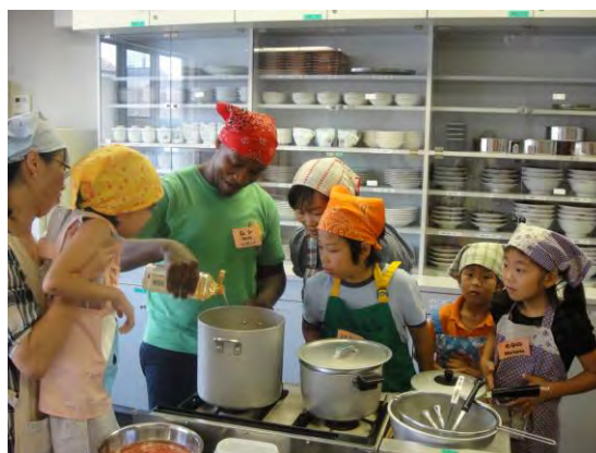
留学生とクッキング