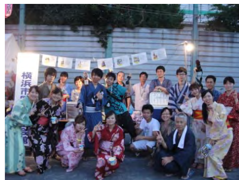
潮田西部地区盆踊り大会