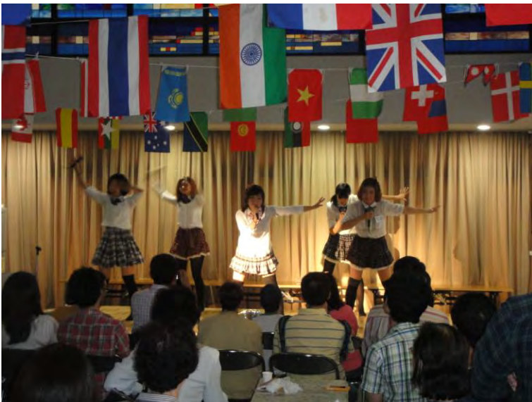
中国・韓国・日本の学生による学生会館 AKB ダンスグループ