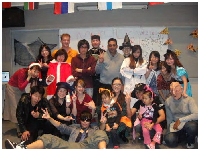
ハロウィーンパーティ