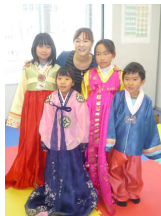
絵本でわくわく世界探検