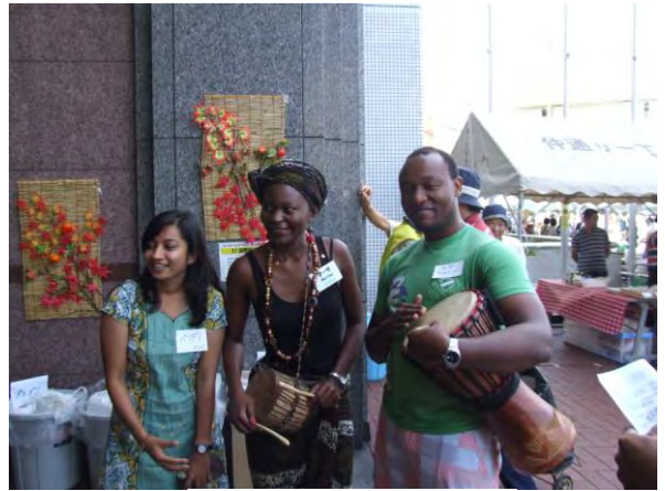
アフリカの太鼓の演奏

7カ国（イタリア、インド、スリランカ、中国 ベトナム、マラウィ、メキシコ）のブースで 茶菓提供と文化紹介、ステージで歌や踊り、 アフリカの太鼓の演奏